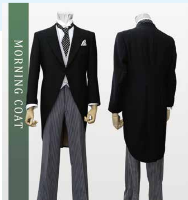
モーニングコート 昼の正礼装