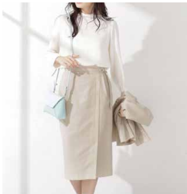
◆スカートスタイル