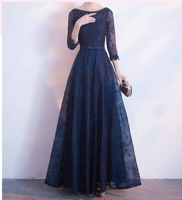
イブニングドレス 夜の正礼装