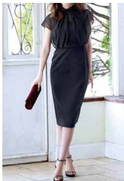
◆ワンピーススタイル