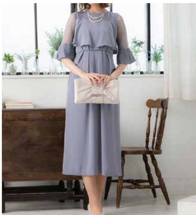
アフタヌーンドレス 昼の正礼装