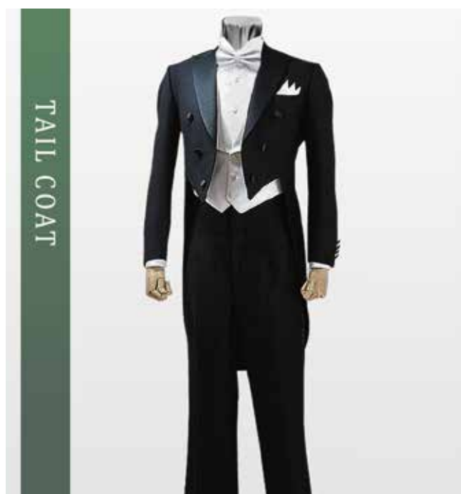
テールコート 夜の正礼装