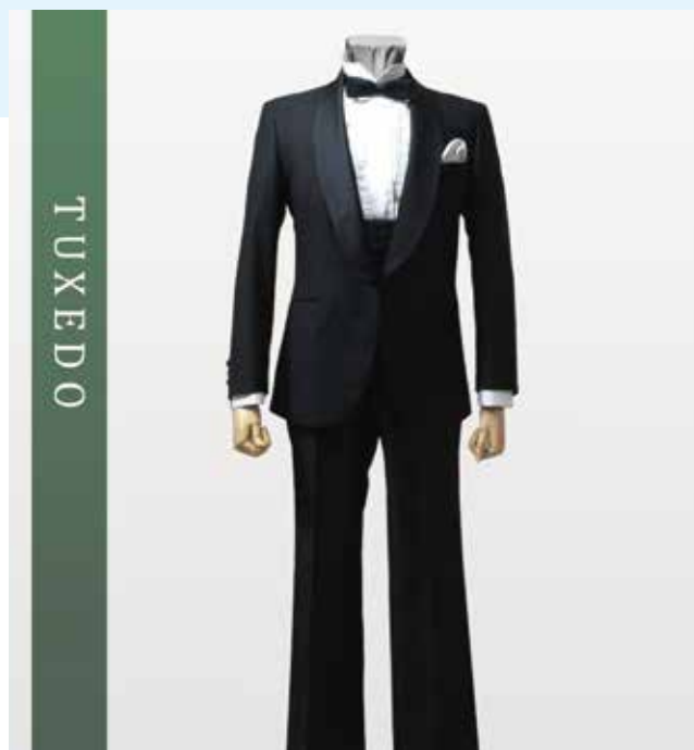
タキシード 夜の正礼装